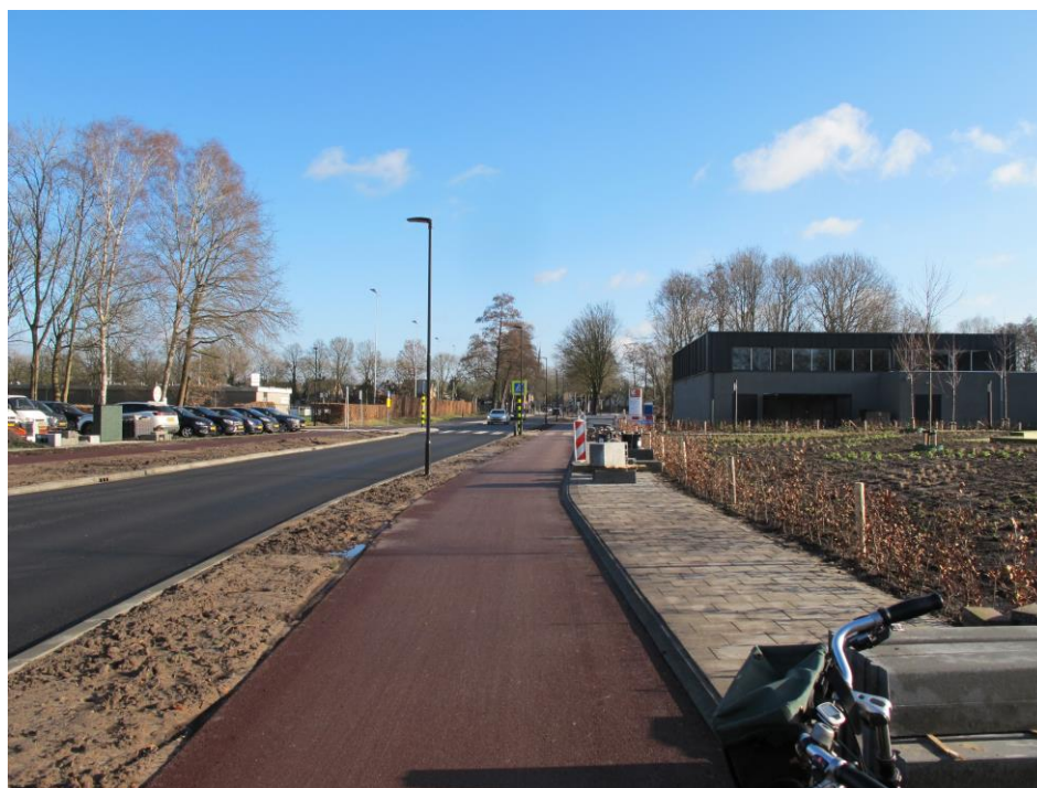
Nieuw fietspad Beatrixlaan