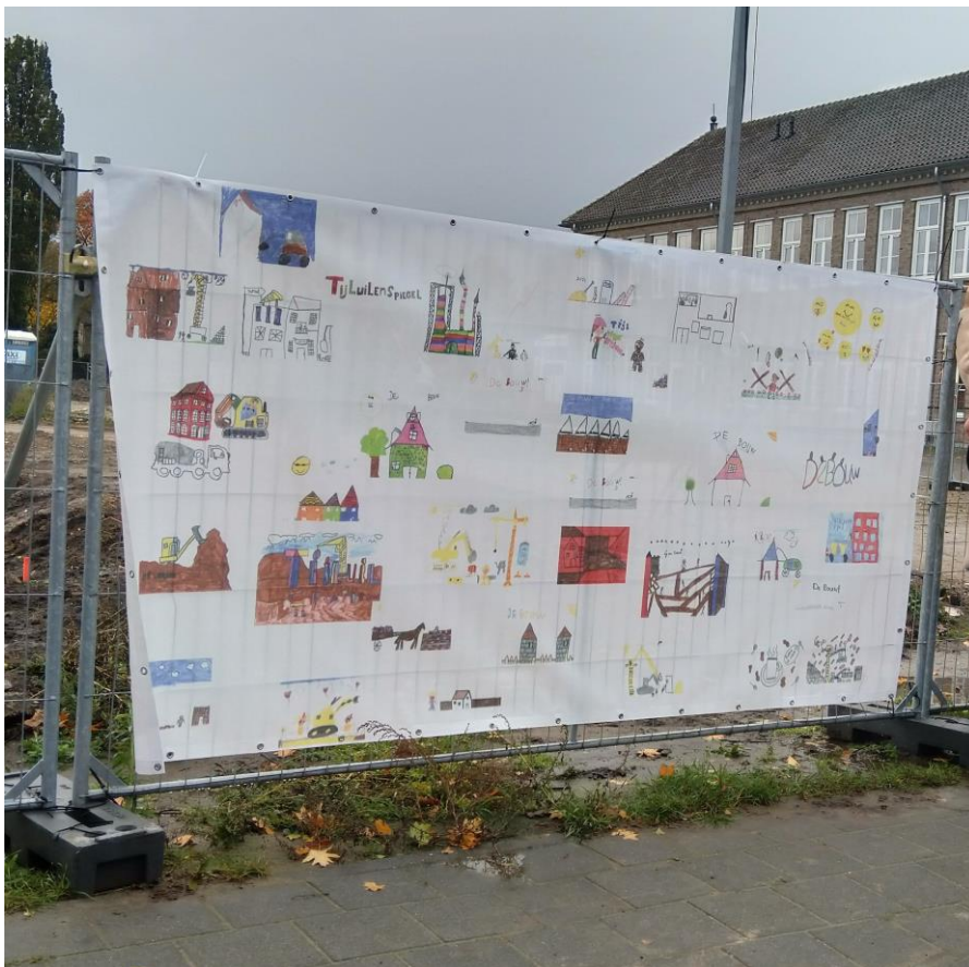
Tekeningen gemaakt door kinderen bij inbrei-locatie Deurne