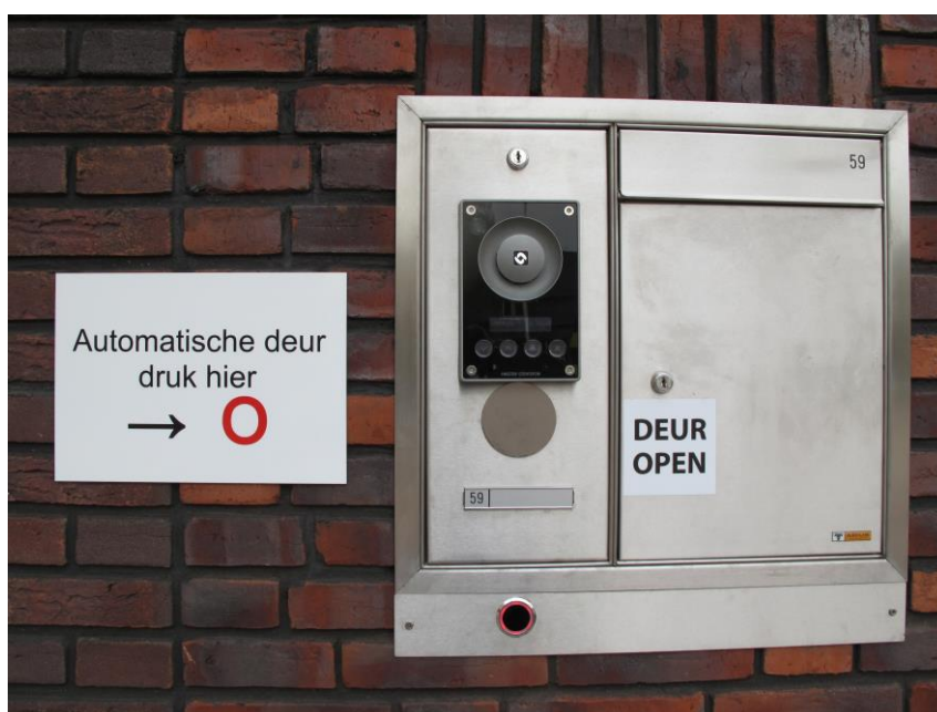
De verwijzing naar de knop helemaal onderaan is onduidelijk