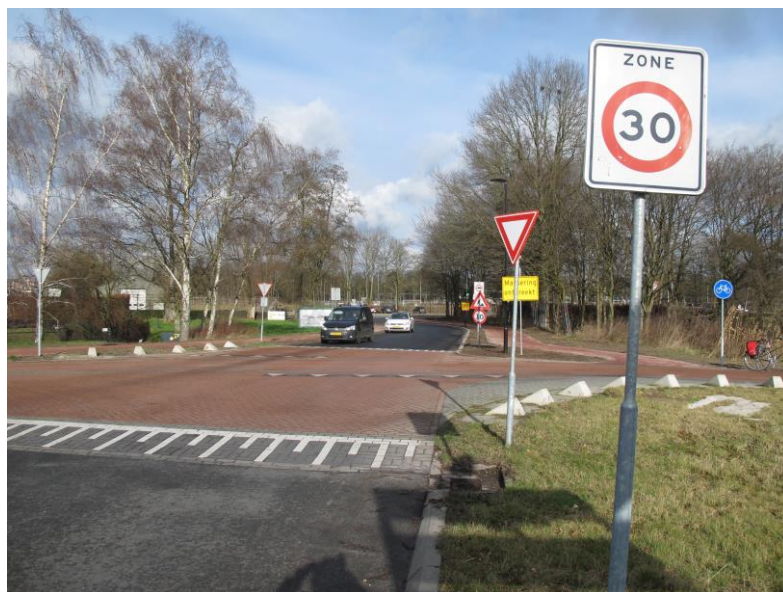
Fietsstraat bij nieuwe rotonde Beatrixlaan Asten